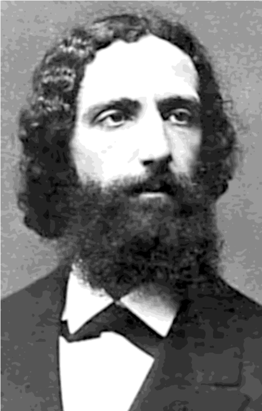
Figural. Franz Brentano, fotografía de dominio público.

Podría hacerse referencia a otras figuras, pero lo desarrollado hasta aquí permite mostrar que el legado de Brentano es amplio y, a la vez, difuso: se expande por el ámbito de la filosofía, la psicología e incluso el psicoanálisis, pero no tanto como una influencia directa, sino por el reconocimiento otorgado posteriormente por sus discípulos y por la apertura de un abanico de temáticas que se vuelve posible explorar y desarrollar.